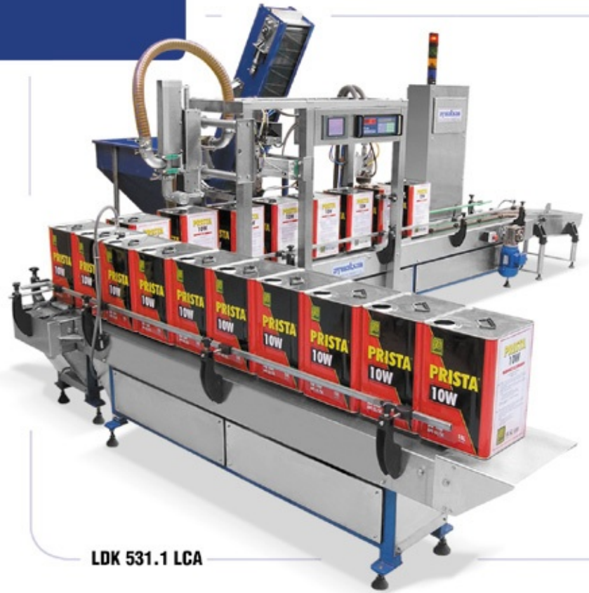
LDK 531.1 LCA