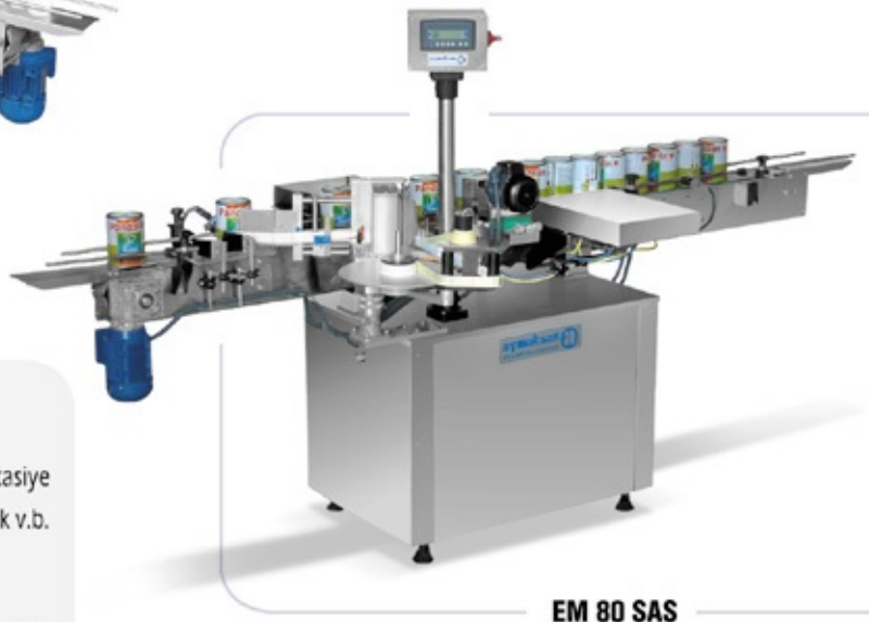
EM 80 SAS