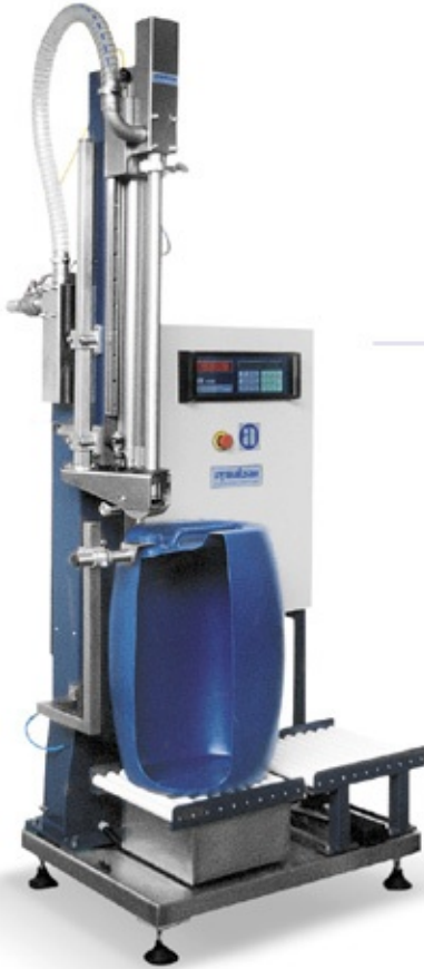
LD 3061 LCM Dn