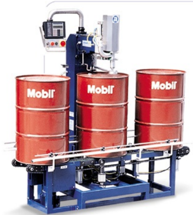
LD 301 LCA