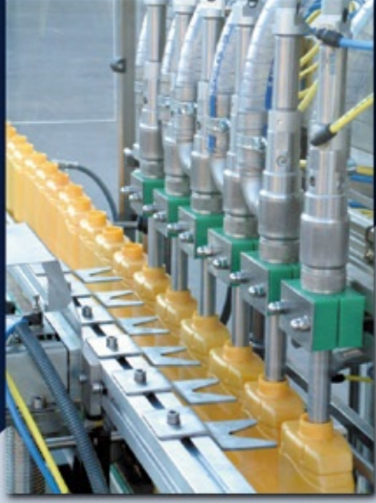
Dolum Başlıkları ve Şişe Boğaz Merkezleme Filling Heads and Bottle Centering