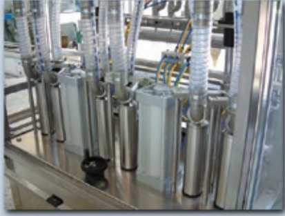
Dolum Silindirleri ve Gramaj Ayar Filling Heads and Volume Adjustmen