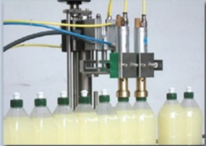
Vidalı Kapak Kapama Ünitesi Screwing Head