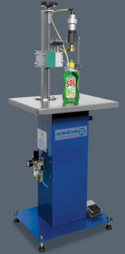
KV 1201 PM KAPAK KAPAMA MAKİNESİ CAPPING MACHINE