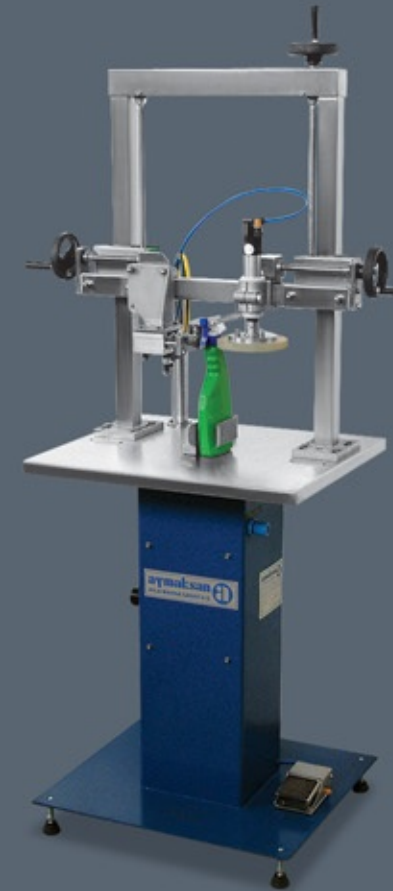
KVT 1001 PM TRİGER KAPAMA MAKİNESİ TRIGGER CAPPING MACHINE