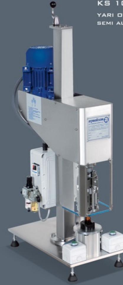
KS 1001 PM YARI OTOMATİK PP KAPAK SIVAMA MAKİNESİ SEMI AUTOMATIC PP CAPPING MACHINE