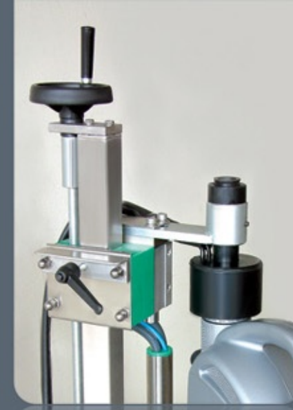
CSG 901 PM YARI OTOMATİK FOLYO KAYNAK MAKİNESİ SEMI AUTOMATIC INDUCTION SEALING MACHINE