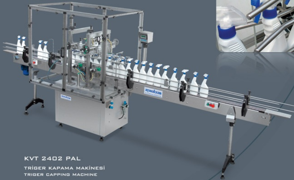
KVT 2402 PAL TRİGER KAPAMA MAKİNESİ TRIGGER CAPPING MACHINE