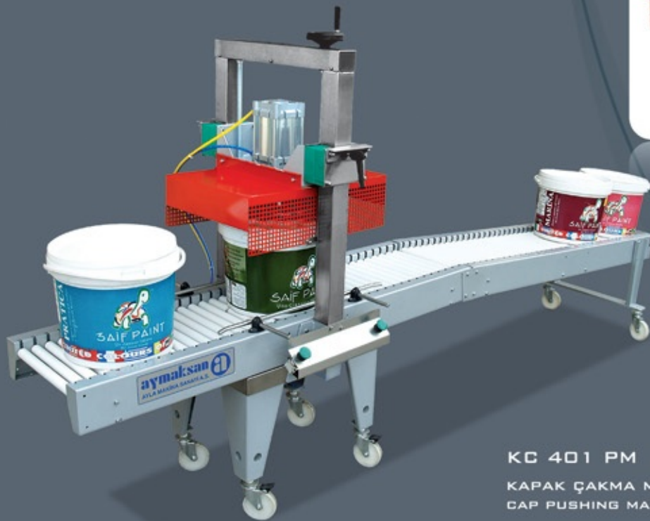
KC 401 PM KAPAK ÇAKMA MAKİNESİ CAP PUSHING MACHINE