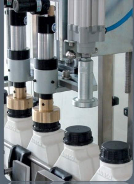
KV 2802 PAL KAPAK KAPAMA MAKİNESİ CAPPING MACHINE